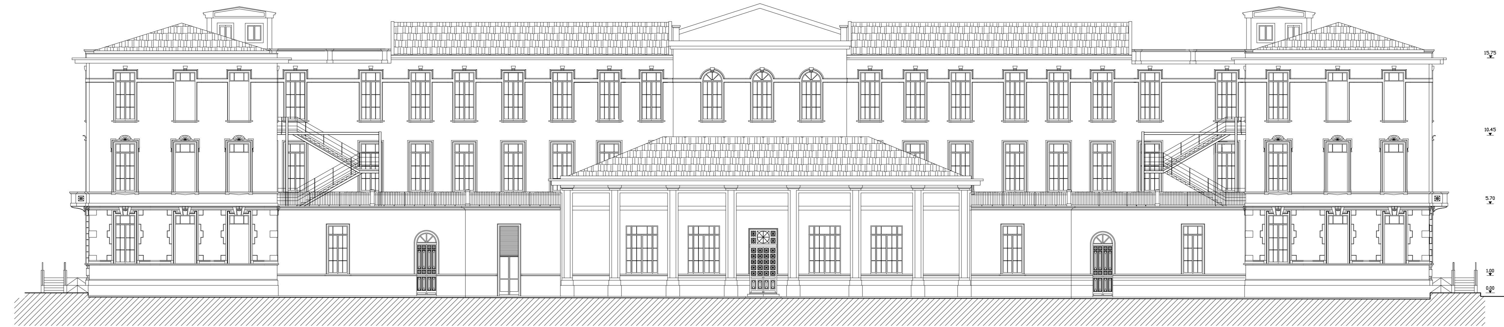
prospetto su via Bixio

prospetti All. C.6 Rev. N. 01 Aggiornato al D.lgs 18 Aprile 2016 n. 50 e ss.mm.ii. data gennaio 2017