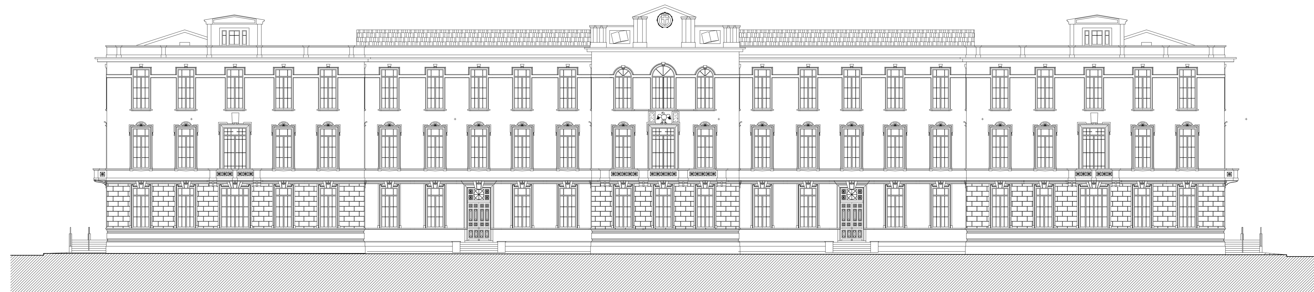
prospetto su via Cavour