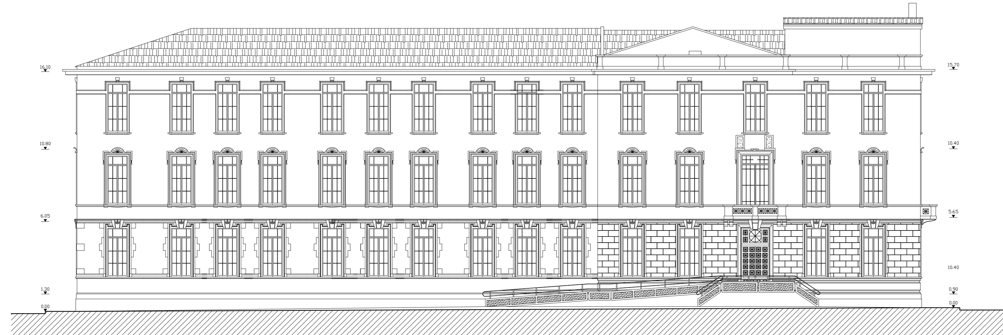
prospetto su via Milano